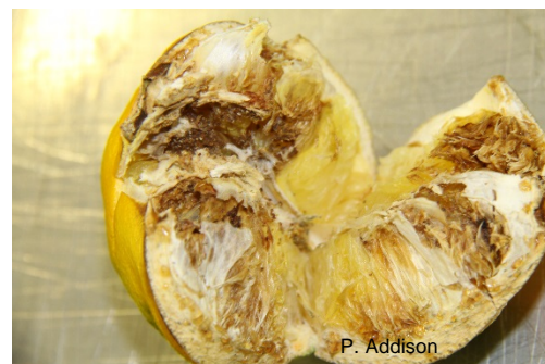
Karobmot, Ectomyelois ceratoniae , voedingskade.