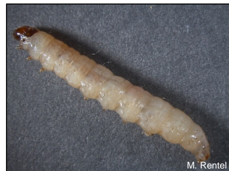
Karobmot, Ectomyelois ceratoniae larwe.