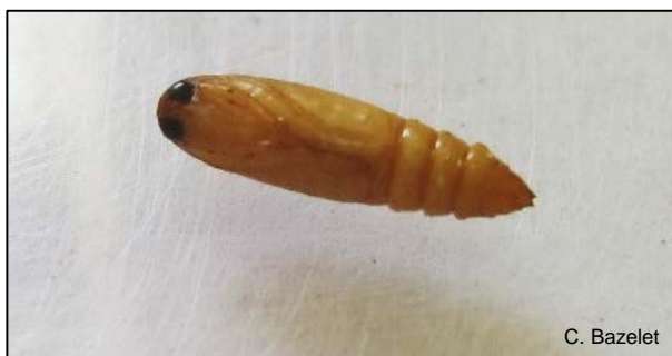
Karobmot, Ectomyelois ceratoniae , papie.