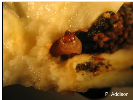
Karobmot, Ectomyelois ceratoniae , voedingskade.

In Suid-Afrika is meer as 50 gashere identifiseer, waarvan heelwat eksotiese spesies is. Karobmot is 'n minder erge pes op sitrus (veral pomelo), asook granate, pekan en makadamia neute.