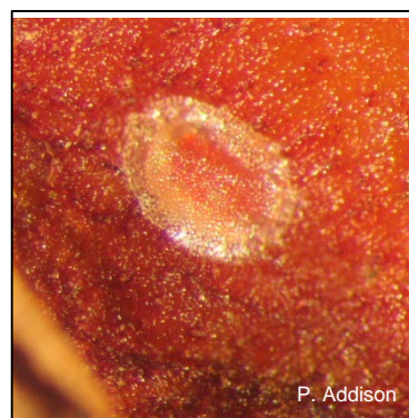
Karobmot, Ectomyelois ceratoniae , eier.

Volwassenes is klein, onopvallende, gryserige motte met verskillende lengtes, vlerk merke en genitale strukture. Die agterste vlerk is liggrys met lang hare op die rante.