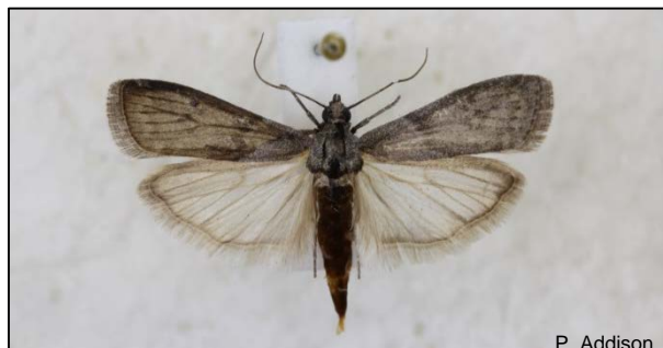
Karobmot, Ectomyelois ceratoniae , volwassene.

Die karobmot het moontlik 4 tot 5 generasies per jaar in goeie omstandighede. Larwes oorwinter in beskikbare sitrus of ander vrugte. Boord-sanitasie (verwydering van vrot of gevalle vrugte) blyk belangrik te wees om lae karobmot populasies te handhaaf. Hul getalle is hoër in boorde met erge infestاسies van witluise of ander insekte wat heuningdou afskei en boorde met roetskimmel of swam groei. Daar is twee lokvalle kommersieel beskikbaar in Suid-Afrika vir karobmot. Die chemiese beheermiddels vir valskodlingmot behoort ook effektief te wees.